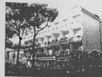
Hotel Roxy - Pinarella di Cervia